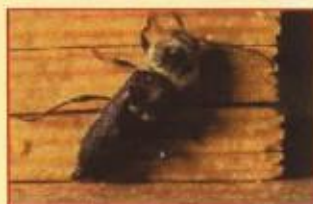
Hylotrupes Bajulus Capricórnio