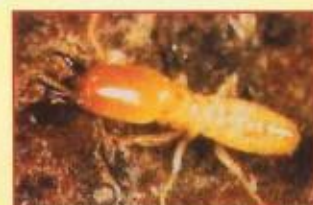
Reticulitermes Santonensis Térmita

A resistência das madeiras é muitas vezes afectada por agentes biológicos ou atmosféricos. Para evitar que isto suceda devem ser tratadas com produtos adequados que lhe permitam aumentar a sua durabilidade.