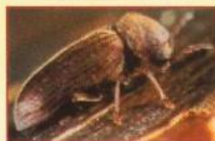
Anobium Punctatum (Peq.) Xestobium Rufolisum (Grande) Caruncho Vulgar