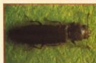
Lycetus Brunneus Caruncho do Parket